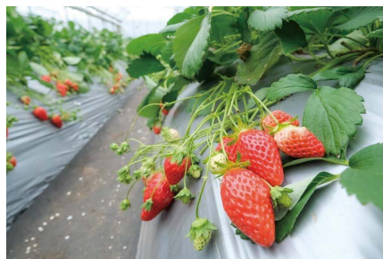
▲旬のイチゴ狩りや動植物との触れ合いなどが楽しめます

申込 12月21日~1月12日の平日午前9時30分~午後6時に電話で、(株)農協観光地域共創事業部(柴田) ☎080(5908)9202へ。先着40人(最少催行人員25人)